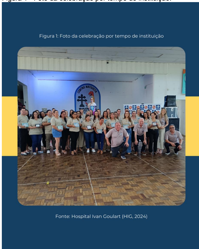
Figura 1 - Foto da celebração por tempo de instituição.

Mensalmente, o Hospital Ivan Goulart também promove um encontro especial com os aniversariantes do mês (Figura 2), conduzido pela diretora administrativa. Esse momento de celebração é marcado pela valorização individual de cada colaborador, que tem a oportunidade de compartilhar seu tempo de casa, setor de atuação e as atividades que desempenha na instituição.