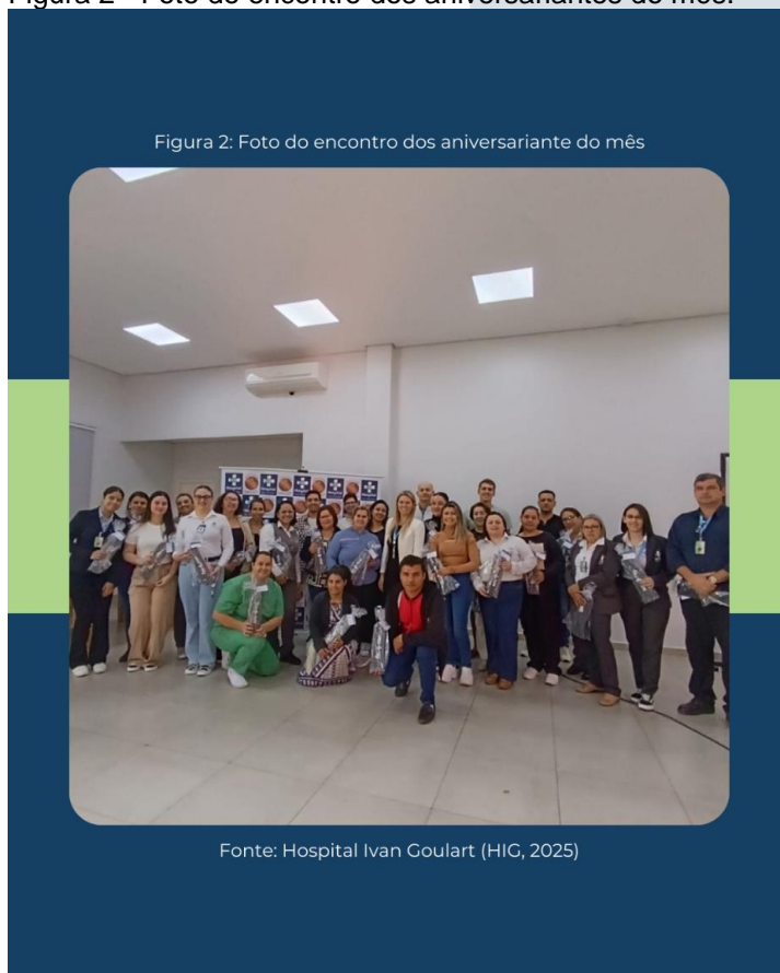
Figura 2 - Foto do encontro dos aniversariantes do mês.

A premissa do projeto é que colaboradores bem acolhidos e acompanhados contribuem com melhores resultados institucionais. A metodologia adotada combinou o ciclo PDCA ( Plan, Do, Check, Act ) com a Gestão com a Gestão por Competências, assegurando alinhamento entre comportamentos esperados, metas organizacionais e