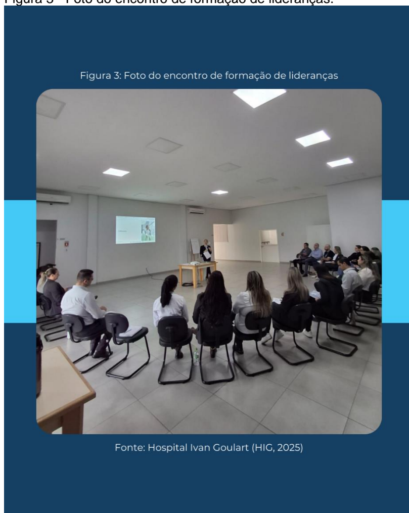
Figura 3 - Foto do encontro de formação de lideranças.