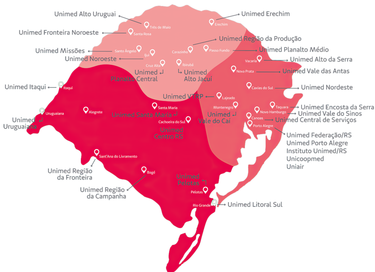
Figura 1: Mapa Sistema Unimed RS - Programa Doador Fiel

Desde 2021, contamos com parceiros como Edenred. Em 2022 já ocorreu a adesão de novos parceiros - Instituto Unimed Central e Lojas Quero-Quero.